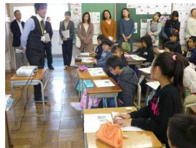
3-1 道徳「わたしの妹」の授業より

地域への授業公開も兼ねた第3回の授業参観懇談会を行いました。11/15(水)は3,4年、16(木)は5年、学習室、17(金)は1,2,6年です。授業は道徳を中心に行いました(4年のみ市音楽発表会の内容等)。保護者及び地域の皆様、お忙しい中、ご来校ありがとうございました。